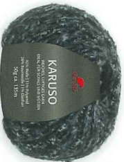
Farbe Nr. 99 schwarz