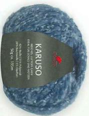
Farbe Nr. 50 marine