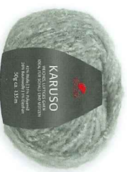
Farbe Nr. 92 grau