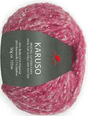
Farbe Nr. 39 bordeaux