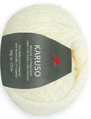
Farbe Nr. 02 natur

42% Wolle 31% Polyamid 26% Baumwolle 1% Elasthan Lauflänge 135m/50g Nadelstärke 5,0 – 6,0